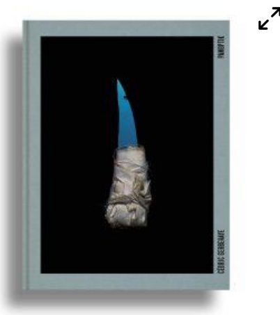
« PANOPTIK », Cédric Gerbehaye, Le Bec en l'Air, 210 p., 50 €.